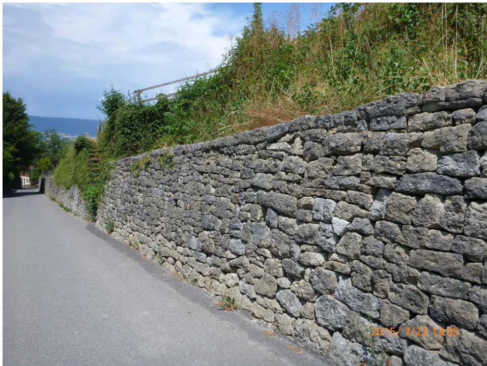
Photos de l'objet 22.07.2015